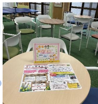
区民ひろば朋有 カフェスペースにて

◆地域福祉に関心がある方等などの目的や意識がある方だけではなく、ご近所さん(地域住民)が区民ひろばに立ち寄った際の自然な日常会話の中から、日々感じている事や思いを感じ、皆さんの持っている宝物を発掘していきます。実は「思っていた」と自分が気づく。そして「やってみようかな」につながればいいなと思っています。思った時にはCSWに教えてください。一緒に考えていきます。「プチぷら」は不定期開催。情報はSNS発信と中央圏域CSWにお問い合わせください。