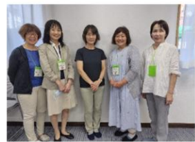
民生委員の皆さん